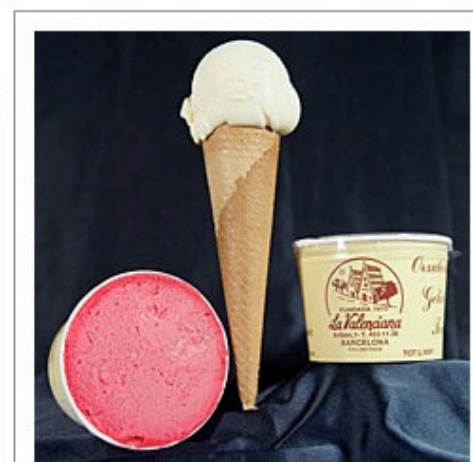
La Valenciana, un clásico